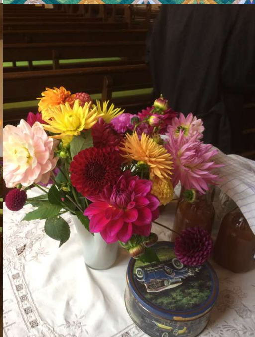
Kirken flot dekoreret til høstgudstjenesten.